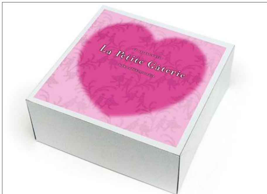
Tout pour faire craquer l'él(u) de votre cœur

C'EST DÉCIDÉ, CETTE ANNÉE, ON BOUDE LE TRADITIONNEL RESTO PSEUDO-ROMANTIQUE OU LES FLEURS PAS VRAIMENT DE SAISON POUR UNE IDÉE QUI SORT DES SENTIERS BATTUS... Au diable donc la spontanéité préfabriquée, place à l'élan du cœur, l'inventivité, la surprise qui lui fera vous faire les yeux doux. Mais avant de vous laisser tenter par "ze" cadeau qui fera chavirer son cœur, remontons un instant aux origines historiques de la Saint-Valentin. Il apparaît que l'Eglise voulut abolir une fête païenne célébrée très précisément le 15 février, lendemain de la fête de Saint-Valentin : les Lupercales. Les Lupercales (du latin "lupus", le loup) étaient liées aux origines de Rome et tirent leur nom du Lupercal, grotte au flanc du Mont Palatin, dans laquelle la Louve allaita les jumeaux Romulus et Remus. Ainsi sauvés par la Louve, ils grandirent et, plus tard, délimitèrent et créèrent la ville de Rome. Les Lupercales devenaient ainsi la grande fête de la reconnaissance et de la fécondité. Cette fête comportait trois actes : le sacrifice d'un bouc, la course des luperques et un banquet.