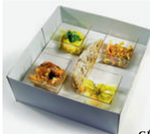
GÉNIALE DE RESTO-PRESTO

POUR CE 14, TROIS COFFRETS PRÊTS À L'EMPLOI, COMPOSÉS CHACUN DE 4 DEGUSTATIONS DIFFÉRENTES AU CONTENU SENSUEL. POUR UNE NUIT HOT, HOT, HOT ! les coffrets se déclinent en trois actes "Les Préliminaires" (mini brochettes de gambas caramélisées au gingembre, salade de fruits de mer à la coriandre et au fenugrec, pommes d'amour au safran cœur de saumon et crème de céleri à la truffe et foie gras ; "Le Plat de Résistance" (tataki de bœuf aux herbes aphrodisiaques et asperges thaï, magret de canard fumé, figues au gingembre et poivre vert, conchiglioni à la perla nera et gratin de céleri rave à la Pompadour) et, pour finir en beauté, "La Petite Gâterie" (mousse au noir de noir, salade de fruits défendus, crème des crèmes aux cuberdons et ranges à vif au Saint-Amour). On a goûté. Elle a craqué. CQFD. Foncez !